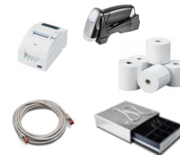
Accessoires et consommables