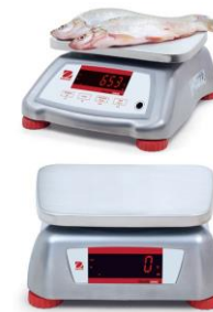
Balance de préparation INOX