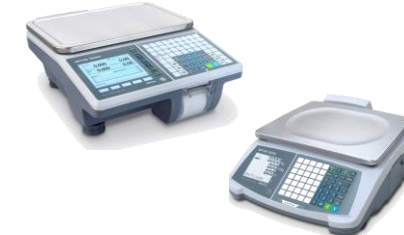
Balance compacte AVEC ticket