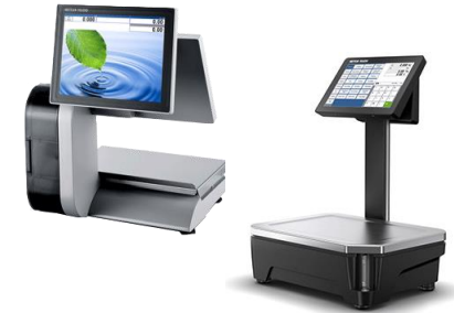
Balance Tactile sur colonne