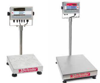
Bascule de table sur colonne