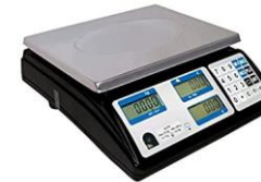
Balance SANS ticket