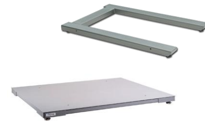
Pèse palette – Bascule au sol