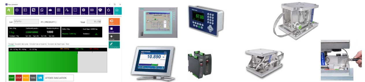
Logiciel Dosage / Soft sur Mesure