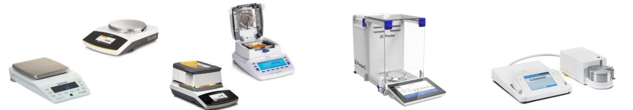
Balance de précision

Nous conseillons, rédigeons et réalisons la QI QO QP. L'ensemble comprend les fiches d'essais, rapports et manuels d'utilisation.